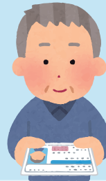
旅行者の本人確認