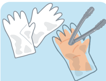
必ず入り口にある 使い捨て手袋を着用し 料理をお取りください