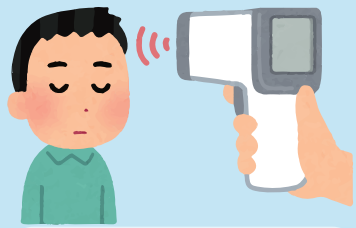
チェックイン時の検温