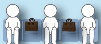
新型コロナ対策として席をあけて お座りいただいております