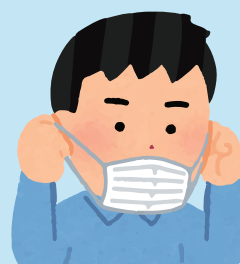
料理をお取りになる際は 必ずマスク着用をお願いします