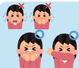
食事中に咳が出る場合 咳エチケットの順守をお願いします