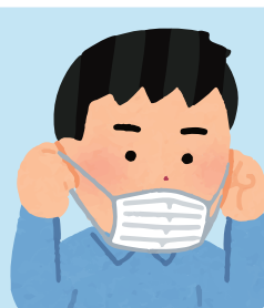
料理をお取りになる際は 必ずマスク着用をお願いします